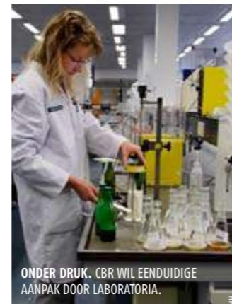
ONDER DRUK. CBR WIL EENDUIDIGE AANPAK DOOR LABORATORIA.

Het CBR vergelijkt deze werkwijze met de ademanalyse. De politie is daar ook niet verplicht de betrokkene op het recht van een bevestigingstest