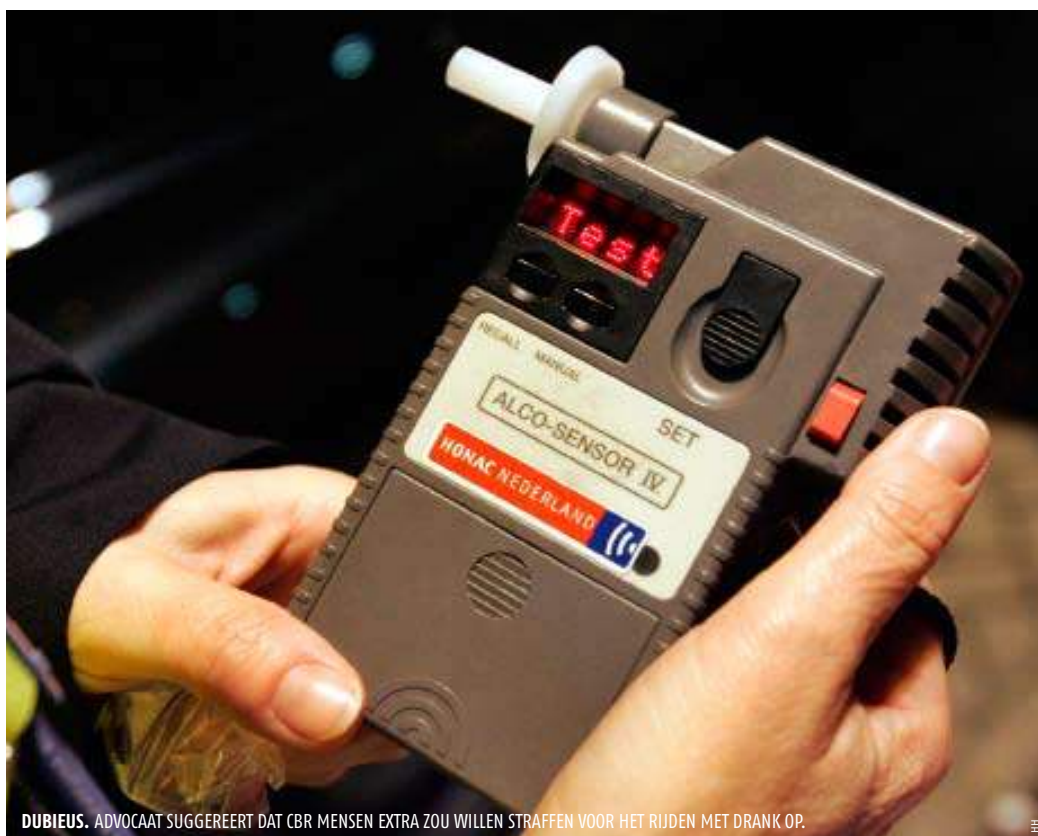
DUBIEUS. ADVOCaat suggereert dat CBR mensen extra zou willen straffen voor het rijden met drank op.

van iemand als extra argument naast alleen de CDT-waarde. De voorgeschiedenis is dan dat iemand heeft gereden met drank op. Maar je komt natuurlijk pas in de invorderingsprocedure als je met drank op gepakt bent. Zo heeft iedereen in de invorderingsprocedure een extra argument naast de verhoogde CDT-waarde.'